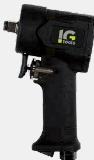
IMPACT WRENCH KP88

Compact 3/8" - 1/2" impact wrenches with single hammer (Jumbo) or Twin Hammer mechanism. Ergonomic design and advanced fluid dynamics.