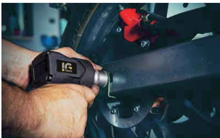
IMPACT WRENCH KP88