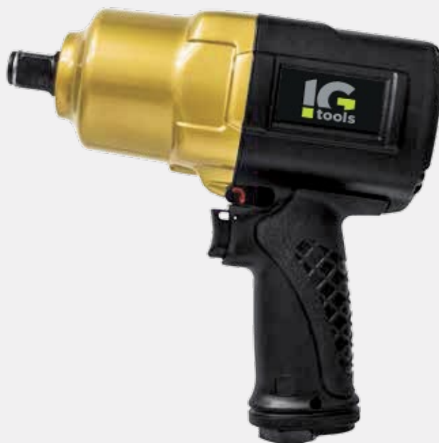
IMPACT WRENCH KP180

3/4" - 1" impact wrenches with Twin Hammer mechanism. Ergonomic design and advanced fluid dynamics.