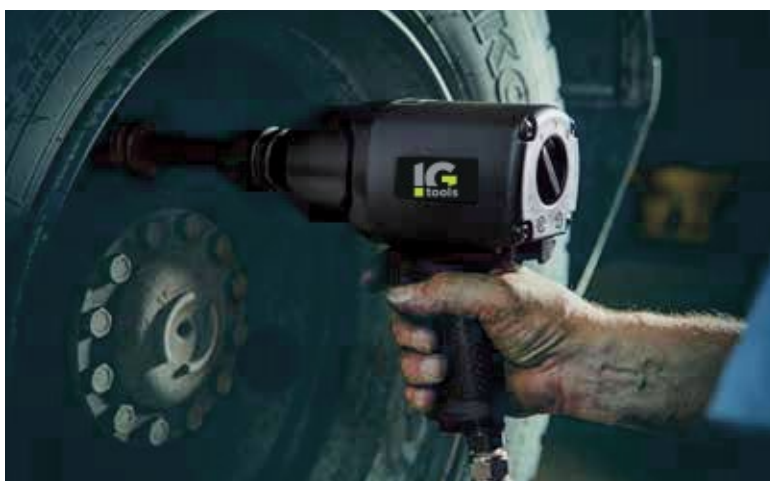
IMPACT WRENCH KP190