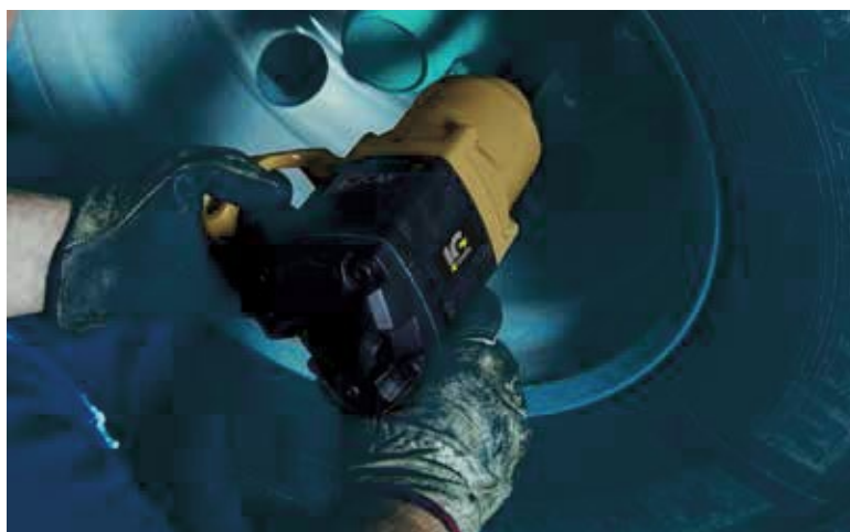
IMPACT WRENCH KP240L