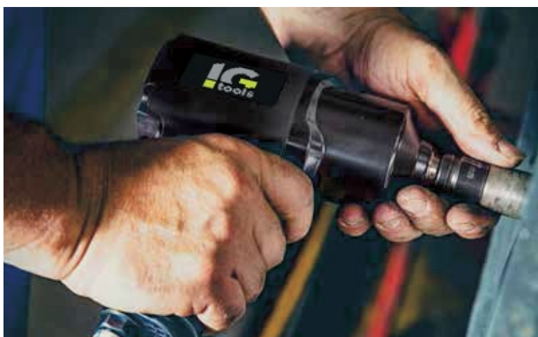
IMPACT WRENCH KP110

INGEGNERIA CIVILE INFRASTRUTTURE CIVIL ENGINEERING INFRASTRUCTURES