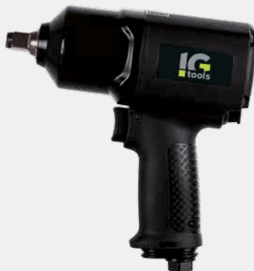
IMPACT WRENCH KP110

1/2" impact wrenches with single hammer (Jumbo) or Twin Hammer mechanism. Ergonomic design and advanced fluid dynamics.