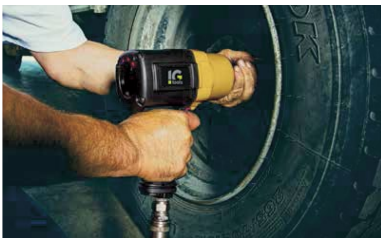
IMPACT WRENCH KP180

INGEGNERIA CIVILE INFRASTRUTTURE CIVIL ENGINEERING INFRASTRUCTURES